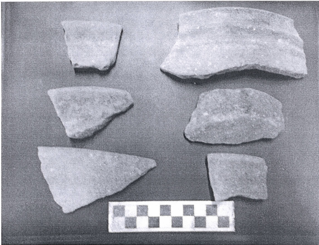
Figura 1. Tipos cerámicos Rocrís (izquierda) y Ropóm (derecha).